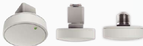
軌道適用 E27底座適用